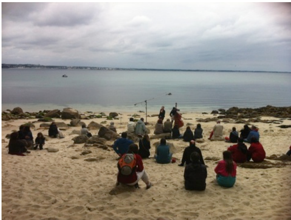
Plage de Lantecoste à Beg-Meil (29)